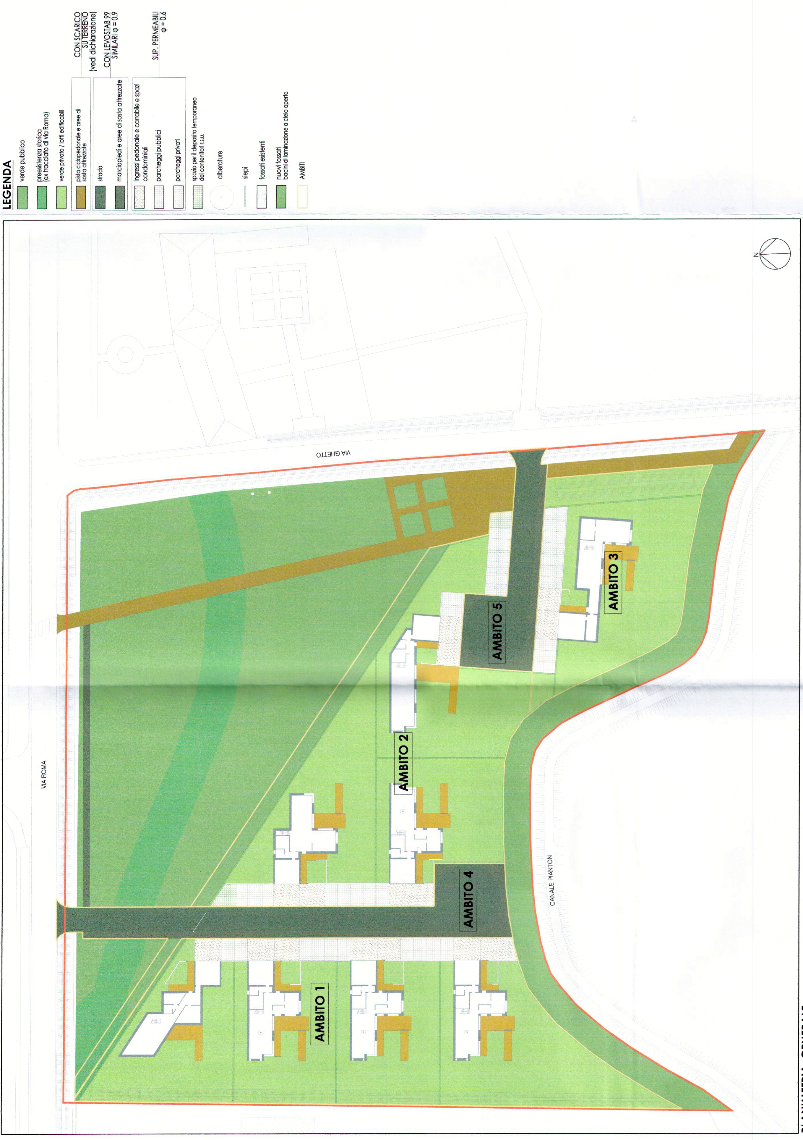
PIANIMETRIA GENERALE scala 1:500